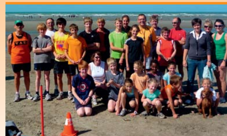
Trainingsstage aan zee