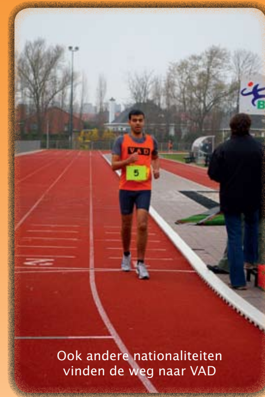
Ook andere nationaliteiten vinden de weg naar VAD