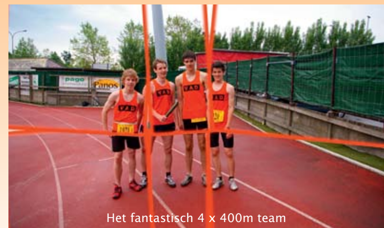
Het fantastisch 4 x 400m team

Wil je de nieuwe ster in de atletiek worden?