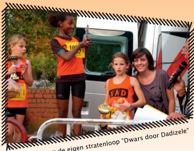
VAD-podium op de eigen stratenloop "Dwars door Dadizele"